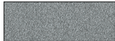
GRIGIO GHISA PD/2616